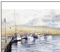
Ilustración de tapa